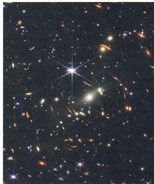
Das erste Deep Field des James-Webb-Teleskops entstand mit einer Belichtungszeit von 12,5 Tagen. Es zeigt einen Ausschnitt des Himmels, so gross wie ein Sandkorn auf der ausgestreckten Hand. Sechszackige Strukturen sind benachbarte Sterne, alles andere sind entfernte Galaxien.

Ich vermute aber, dass hinter dem Interesse an der Frage, wie das Universum entstanden ist, etwas anderes steckt: die Was-Fragen. Was hat das alles zu bedeuten? Was ist der Sinn des Ganzen? Was ist unsere Aufgabe? Die Was-Fragen kann die Astrophysik nicht beantworten. Zum Beispiel „Was ist doch der Mensch, dass du seiner gedenkst?“ ist eine religiöse Frage (Psalm 8,5).